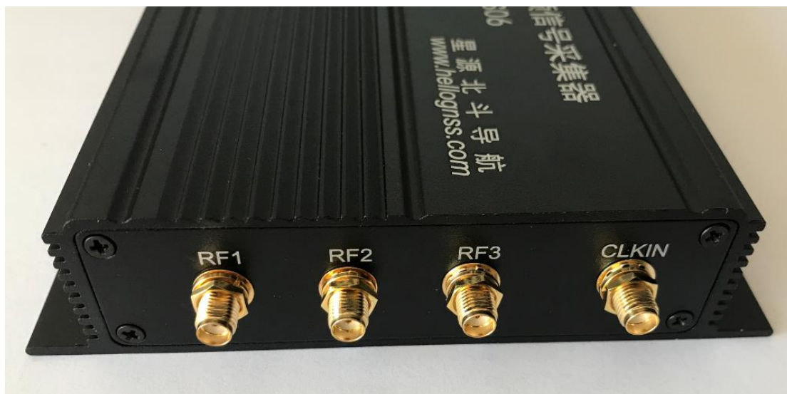
图 3 HG-SOFTGPS06-E 采集器后面板

HG-SOFTGPS06-E 采用 USB3.0 接口,实际的数据传输采集带宽可达 260MB/s,传输稳定可靠。