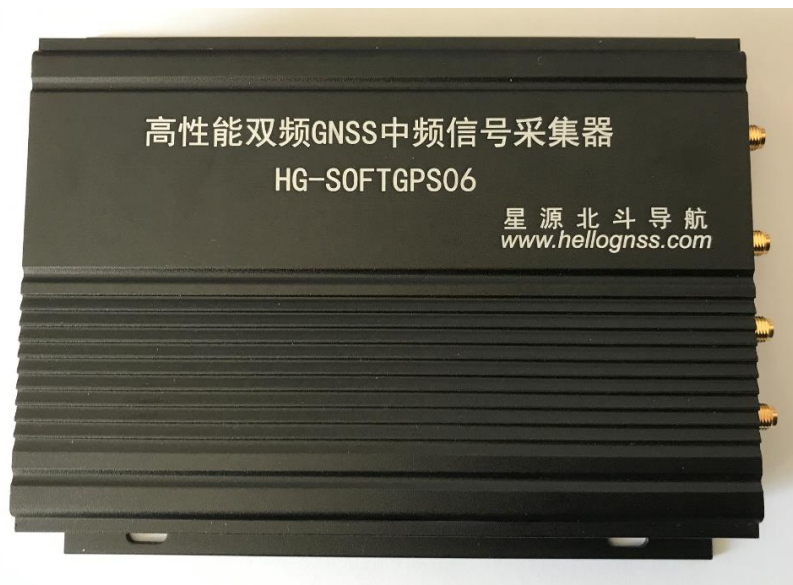
图 1 HG-SOFTGPS06-E 采集器

HG-SOFTGPS06-E 采集器是应客户要求将 RF1 也改为 MAX2112, 并额外增加 RF3 射频, 以适应更多的应用。HG-SOFTGPS06-E 的前面板增加了串口, 如图 2 所示, 客户可以通过串口直接设置射频参数, 设置的参数可以保存在采集器内部, 下次上电仍然有效。HG-SOFTGPS06-E 用内部 STM32 处理器的 DA 控制 MAX2112 的 GC1 脚, 因此可实现非常宽的增益动态范围。更加适合本身增益很强的天线, 比如阵列天线, 抛物面天线的应用。HG-SOFTGPS06-E 提供了 +5V 的外部供电, 大部分情况下可以仅使用 USB3.0 供电即可。