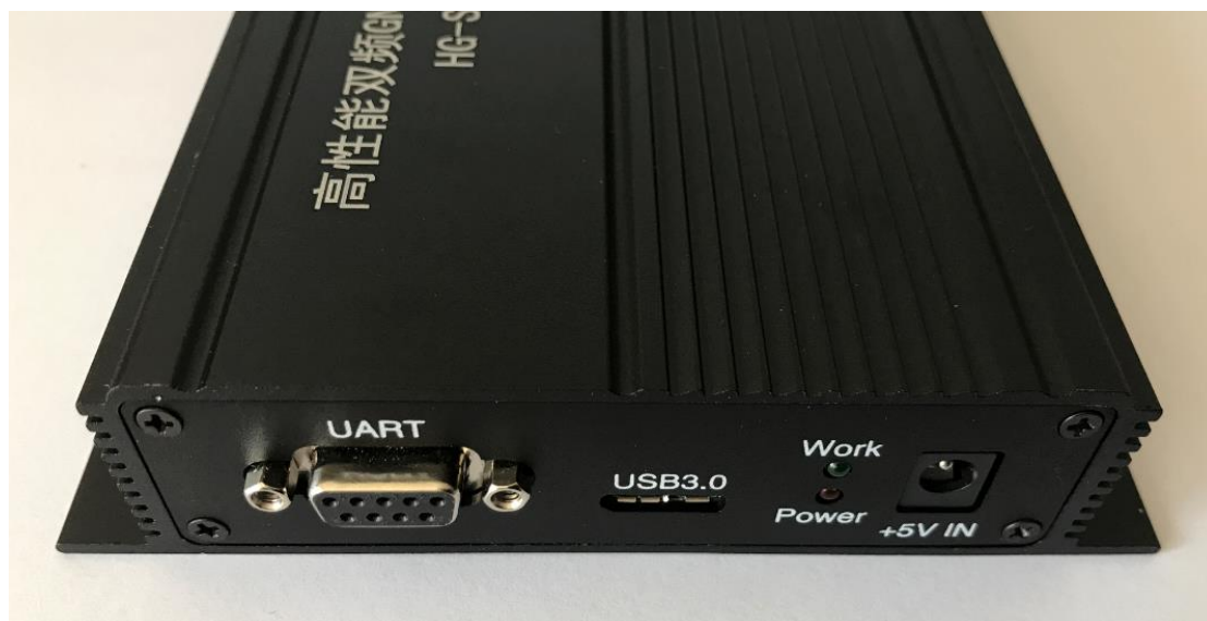
图 2 HG-SOFTGPS06-E 采集器前面板